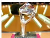
График проведения этапов конкурса выглядит следующим образом:

В столице стартовал 21-й по счёту конкурс «Московские мастера-2018» среди специалистов строительной отрасли. В этом году в профессиональном мастерстве будут состязаться автокрановщики, монтажники стальных и железобетонных конструкций, прорабы в области гражданского строительства, электросварщики ручной сварки и специалисты по охране труда.